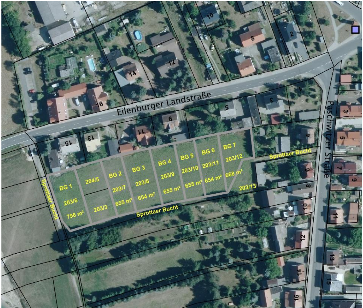
Übersichts- und Lageplan der Baugrundstücke (BG)