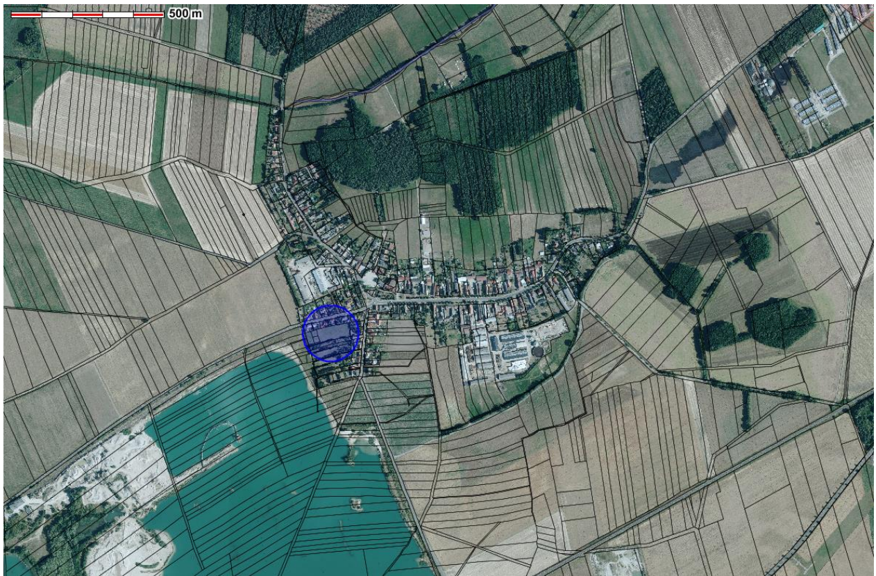
Übersichts- und Lageplan – OT Sprotta