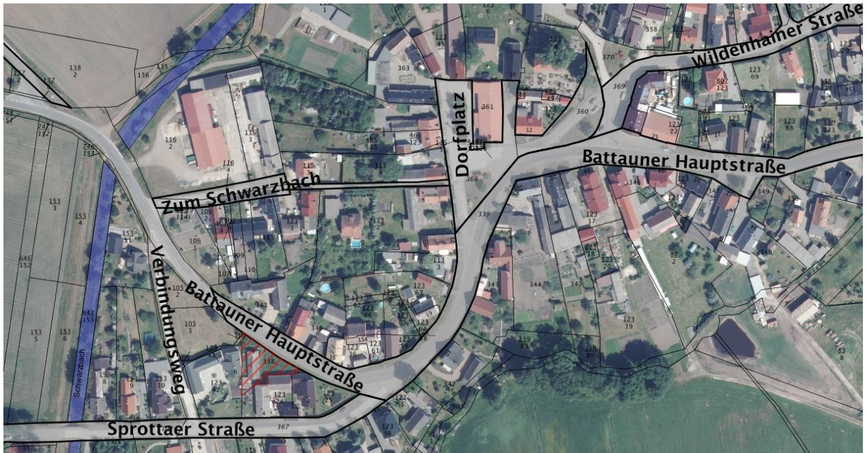
Übersichtsplan (Gebäudebestand ist zwischenzeitlich zurückgebaut, es besteht Baufreiheit)